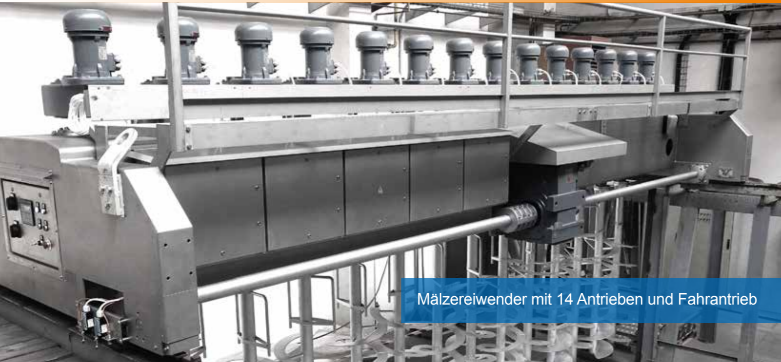
Mälzereiwender mit 14 Antrieben und Fahrtrieb