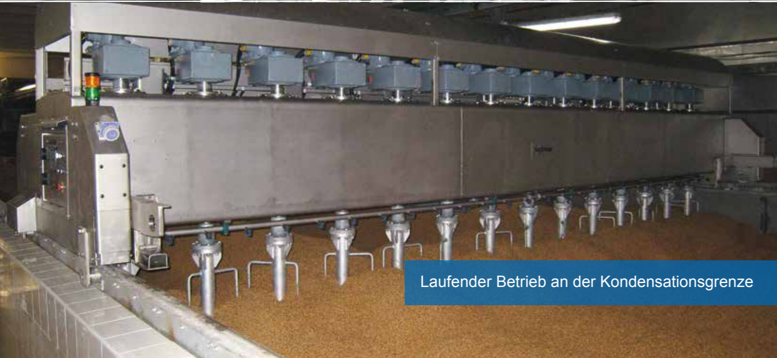
Laufender Betrieb an der Kondensationsgrenze