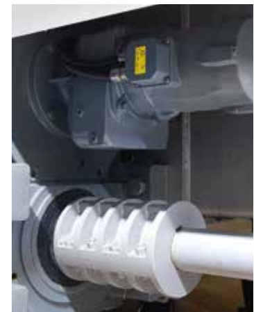
Fahrtrieb. Das BLOCK Flachgetriebe mit Stirnrad-Vorstufe bewegt die Mälzerei-Wender auf Schienen über dem Saladin-Behälter.

Die acht Wender laufen dank hoher Getriebeübersetzung in mäßigem Tempo auf Schienen über die 53 m langen, 2 m tiefen Saladin-Behälter. Die NORD-Frequenzumrichter der Reihe NORDAC PRO SK 500E steuern den Geschwindigkeitswechsel der Motoren in den unterschiedlichen Phasen des Keimprozesses.