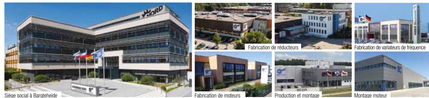
Siège social à Bargteheide