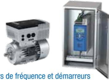
Variateurs de fréquence et démarreurs