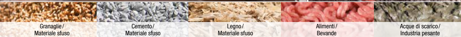
Granaglie/ Materiale sfuso

Affidabili in condizioni estreme – I trasportatori a coclea azionati da NORD nel caldo dell'Indonesia